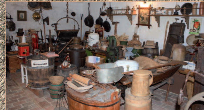
Geschirr aus einer Rauchküche, viele Haushaltsgeräte, Butterfässer, Schnapskessel, Kaffeeröster, Backtrog mit eingeschnitzter Jahreszahl 1731, ...