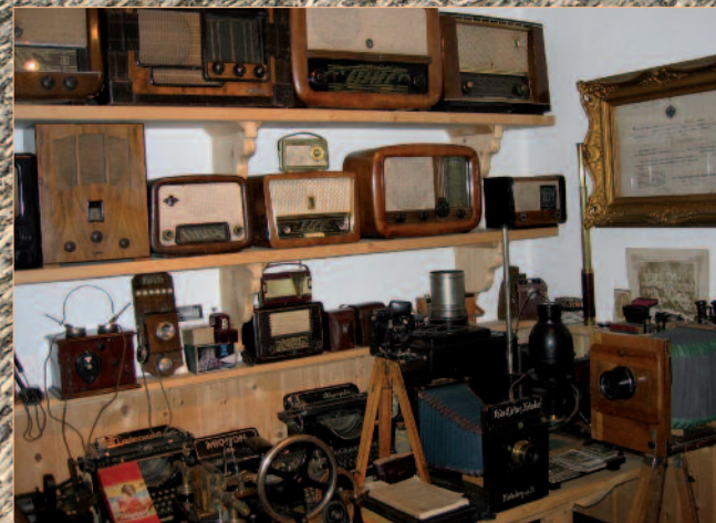
Radios, Fotoapparate, Grammophone, Turmuhr, ...