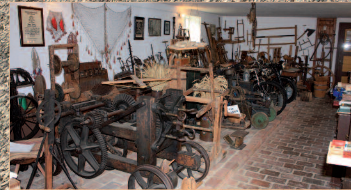
Informiert wird über verschiedene Handwerksberufe (Fassbinder, Tischler, Drechsler, Seiler,...)