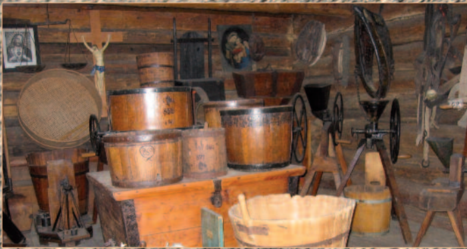
Im über 300 Jahre alten Troadkasten (Titelfoto) sind Metzen, Schrotmühlen und andere Geräte zur Getreideverarbeitung untergebracht.