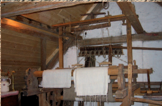
Bauernwebstuhl aus dem Jahr 1856