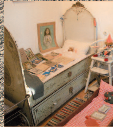
Kinderzimmer mit Wiege, Gitterbett, Spielsachen und Schulbank