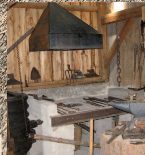
Schmiede aus Lanzenkirchen