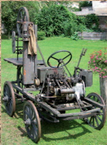
Fahrbare Bandsäge mit Austro Daimler Motor